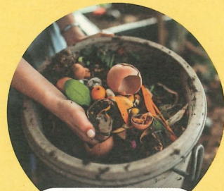
Réceptif ou bioseau