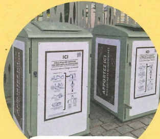
Point d'apport volontaire